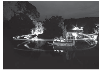
グランプリ作品 「御舟の夜籠り」

他にも、トルコのご飯を紹介したり、学校訪問でトルコ人の紹介をしたり、友好関係のことを子どもたちに教えたりなどを行っています。