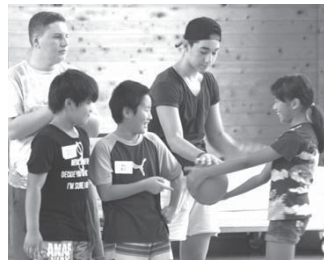
大島小学校の児童たちとレクリエーションで交流