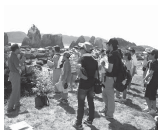
橋杭岩前で説明を聞く子どもたち