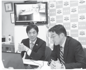
4月29日の記者発表の様子

日本側では、当時の様子を記録した資料が複数残されていました。また、米国側の乗組員から見た資料が見つかったのは初めてとなります。