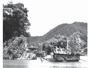
河内祭の御舟行事

かつて捕鯨がこの地域の生活を担う誇るべき産業であったことを物語っていることが評価されました。今後は、捕鯨文化や歴史をもっと多くの人に知ってもらえるよう和歌山県及び構成市町村と連携して取り組んでまいります。