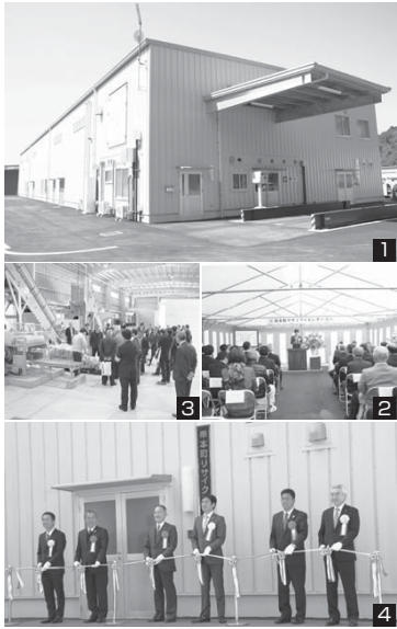
①リサイクルセンターの外観 ②竣工の様子 ③施設内を見学する関係者 ④テープカットの様子