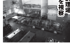
川川町学校給食共同調理場 御坊市立給食センターを模倣

平成26年12月11日(木)本会議終了後 1) くしもと病院の医療体制について 2) 住民課所管業務について