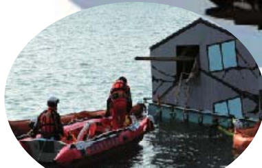
消防・警察・自衛隊による 倒壊家屋・漂流者捜索訓練