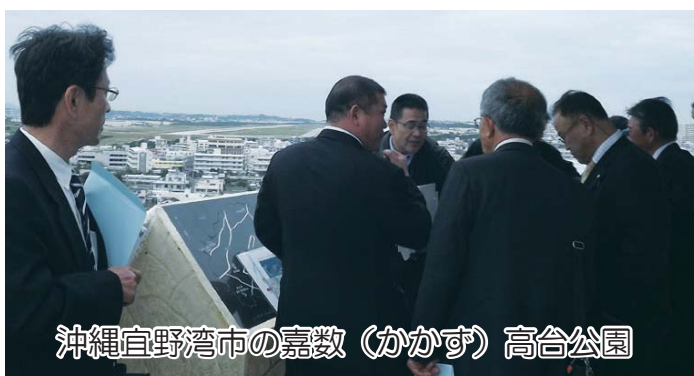
沖繩宜野湾市の嘉数(かかず)高合公園

今年度は常任委員会の 県外視察の年で、それぞ れの視察報告を掲載して いまます。近隣の町村と 比較ばかりして、先 進地を見るときは、普 の活動が井の中の蛙で るかがよくわかりませ る。問題は学んだこと ですか。串本町政に生か します。次回の議会でき ります。掲載できればと