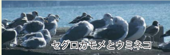
セグロカモメとウミネコ