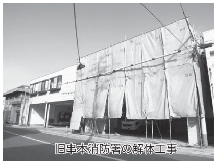
旧串本消防署の解体工事