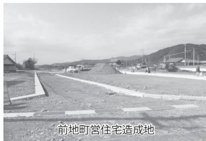
前地町営住宅造成地

平成25年第3回定例会は9月11日(水)より26日(木)までの日程で開催されました。条例案件5件、補正予算案件9件、平成24年度決算認定案件19件、その他の案件5件、意見書3件の審議が行われました。