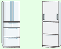
冷凍・冷蔵庫、冷凍庫